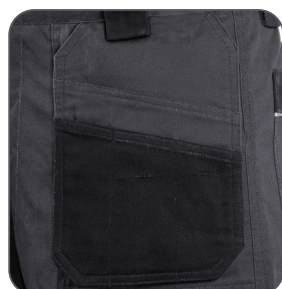
levá přední kapsa ľavé predné vrecko front left pocket przednia lewa kieszonka