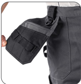
přední volně visící kapsy - hřebičenky predné voľne vrecká - kapsy na kľince front hanging pockets - nail pouches kieszenie przednie wolnowiszące - na narzędzia