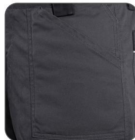
levá přední kapsa - zasunutá ľavé predné vrecko - zasunuté front left pocket - inserted przednia lewa kieszeń - schowana