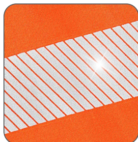
segmentované reflexní pásky segmentované reflexné pásky segmented reflective tapes segmentowe taśmy odblaskowe