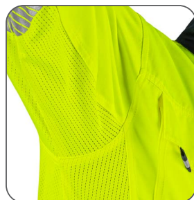
síťovina v podpaží sietovina v podpažiu underarm mesh panel siateczka pod pachami