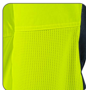
síťovina v zadní kolenní části sieťovina v zadnej časti kolena mesh back knee part siatka z tyłu kolana