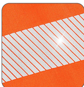
segmentované reflexní pásky segmentované reflexné pásky segmented reflective tapes segmentowe taśmy odbłaskowe